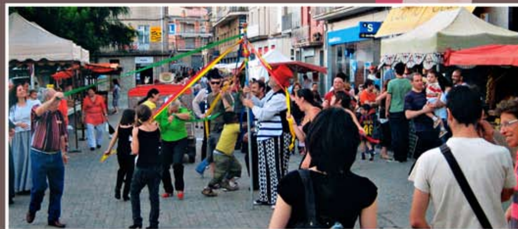
1r. Premi Fira del Vapor 2009; Autor: Guillem Figols Checa; Títol de l'obra: Animació Fira del Vapor